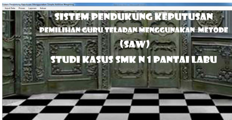
Gambar 3. Menu utama

Pada form login, admin harus memasukkan username dan password. Jika username dan password dan kata sandi tidak sesuai maka proses login tidak dapat dilakukan